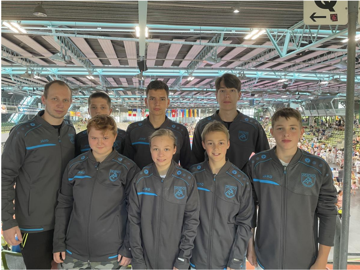
Die Teilnehmer U15 (oben) und der U18 (unten) des JVR in Sindelfingen .