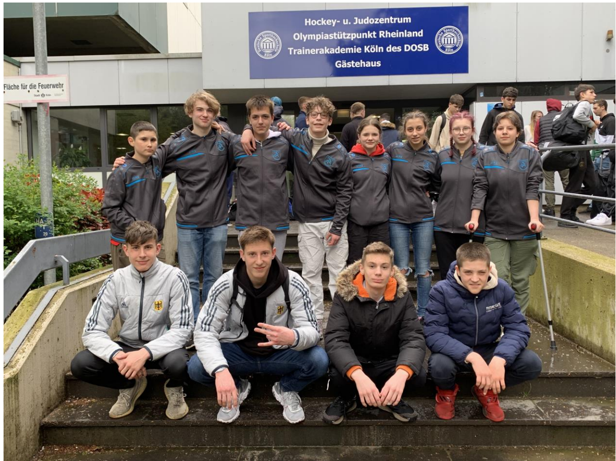
Die Teilnehmer des JVR am Trainingslager vor dem Bundesleistungszentrum.