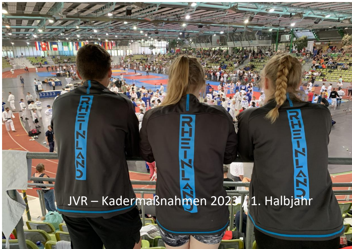
JVR – Kadermaßnahmen 2023 / 1. Halbjahr

Im ersten Halbjahr 2023 wurden insgesamt 8 Kadermaßnahmen durchgeführt. Los ging es im Januar als Vorbereitung für die SWDEM und DEM U18 und U 21 mit einem 3-tägigen Lehrgang in Koksijde / Belgien. Teilnehmer waren neben den 250 Kämpfern aus 7 Nationen auch 7 Rheinländer